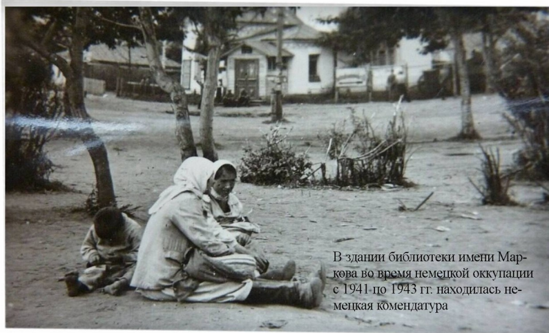
В здании библиотеки имени Маркова во время немецкой оккупации с 1941 по 1943 гг. находилась немецкая комендатура

Война никого и ничего не пощадила. Был нанесен огромный ущерб и библиотекам. В здании районной библиотеки